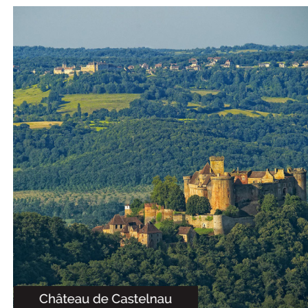
Château de Castelnaud

route, poursuivre à droite jusqu'au hameau de Félines. Prendre à droite après le pont. Avant le panneau Bretenoux, prendre à droite direction « Ségaro ». À ce lieu-dit, prendre à gauche l'itinéraire emprunté à l'aller pour rallier le point de départ de la randonnée.