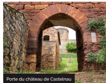
Porte du château de Castelnaud

Elle se situe près des confluences des rivières de la Cère et de la Dordogne. Son existence remonte au IX e siècle. En 1277, le baron Guérin de Castelnaud y fonde une bastide ou « ville neuve ». Il confie l'administration à 4 consuls élus par les habitants. Le réseau de rues et de ruelles (carreyras et carreyrous), pavées de galets, s'organisent en damier autour de la place du marché avec ses maisons à pan de bois, ses couverts ou porches. La bastide était entourée de remparts à créneaux et de fossés destinés à fortifier les défenses. Elle présente encore des vestiges de remparts et la porte dite « de la Guierle » témoigne des anciennes fortifications.