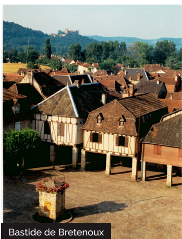
Bastide de Bretenoux